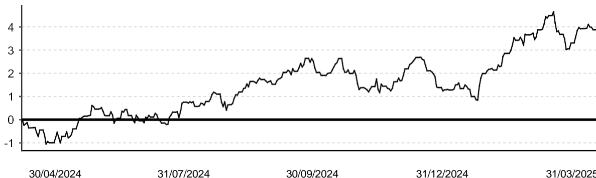
GRÁFICO EVOLUCIÓN VALOR LIQUIDATIVO CBNK FUTURO RENTA FIJA MIXTA F.P.

GASTOS GENERALES 1,87% (INCLUYE COMISIÓN DE GESTIÓN Y DEPÓSITO, SERVICIOS EXTERIORES Y OTROS GASTOS DE EXPLOTACIÓN)