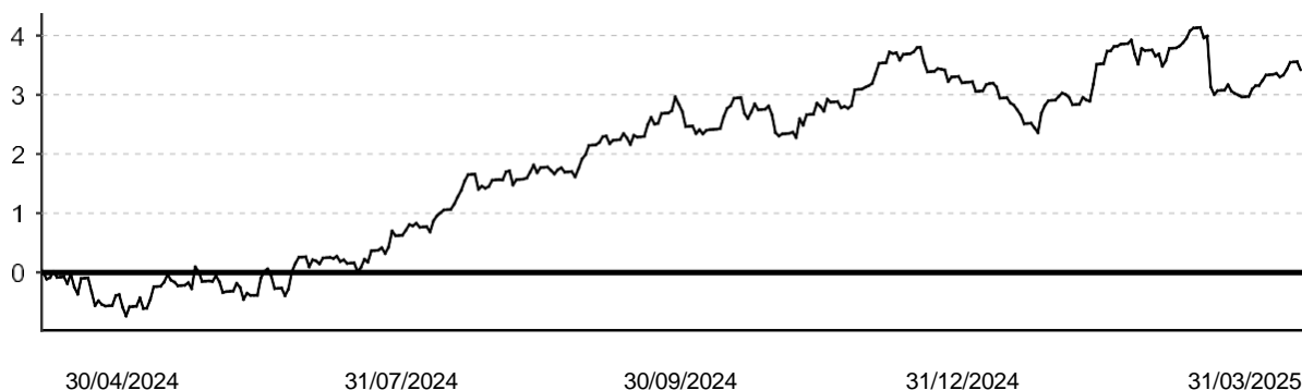
GRÁFICO EVOLUCIÓN VALOR LIQUIDATIVO CBNK FUTURO RENTA FIJA LARGO PLAZO F.P.

GASTOS GENERALES 1,00% (INCLUYE COMISIÓN DE GESTIÓN Y DEPÓSITO, SERVICIOS EXTERIORES Y OTROS GASTOS DE EXPLOTACIÓN)